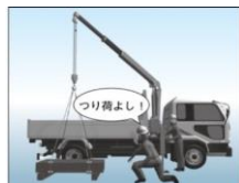
小型移動式クレーン