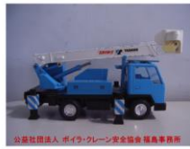
高所作業車運転技能講習開始