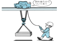
床上操作式クレーン