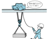
床上操作式クレーン