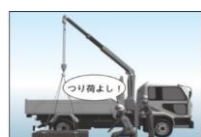
小型移動式クレーン