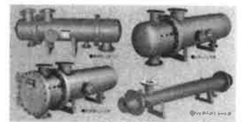
熱交換器(液体加熱器)

○アキュムレータ(スチームアキュムレータ、フラッシュタンク、脱気器等) [内容積が1m 3 を越えるもの]