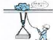
床上操作式クレーン