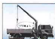
小型移動式クレーン